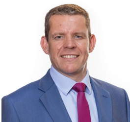
Rhun ap Iorwerth AS

O ran ein cynlluniau ar gyfer y flwyddyn sydd i ddod, byddwn yn edrych ar y gefnogaeth sydd ar gael i Aelodau o'r Senedd i'w galluogi i gyfrannu yn eu dewis iaith, ac i fod yn hyderus wrth wneud hynny mewn trafodion neu yn eu hetholaeth. Byddwn hefyd yn ystyried ein prosesau cynllunio ieithyddol gan edrych ar gynlluniau iaith y gwasanaethau unigol a chasglu gwybodaeth am sgiliau iaith Staff y Comisiwn. Bydd hyn oll yn rhoi sicrwydd ynghylch lefelau sgiliau a chapasiti i ddarparu gwasanaethau o'r radd flaenaf.